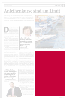
1/4 Seite 134 x 200 mm

Preis € 2.538,- Vorteilspreis € 1.776,60