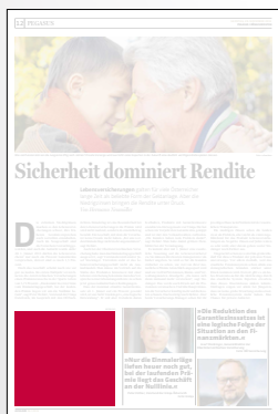
Steckbrief 2-spaltig 106,4 x 100 mm

Preis € 2.538,- Vorteilspreis € 1.776,60