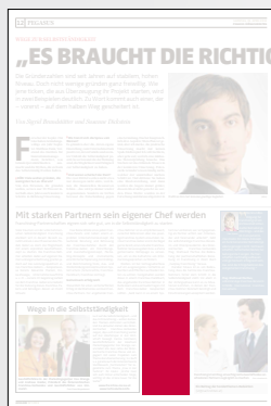
Steckbrief 1-spaltig 51,2 x 100 mm