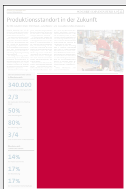
Juniorpage 202 x 265 mm

Preis € 12.690,- Vorteilspreis € 8.883,-