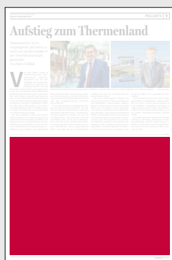
1/2 Seite 272 x 200 mm

Preis € 8.565,75 Vorteilspreis € 5.996,02