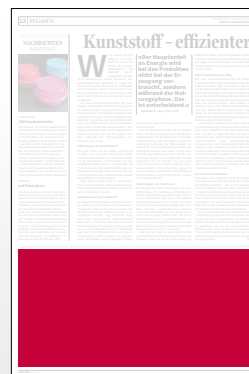
1/3 Seite 272 x 135 mm

Preis € 6.345,- Vorteilspreis € 4.441,50