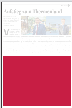
1/2 Seite 272 x 200 mm

Preis € 9.335,25 Vorteilspreis € 6.534,67