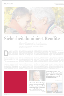
Steckbrief 2-spaltig 106,4 x 100 mm

Preis € 2.766,- Vorteilspreis € 1.936,20