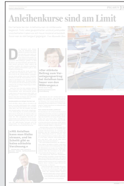
1/4 Seite 134 x 200 mm

Preis € 2.766,- Vorteilspreis € 1.936,20