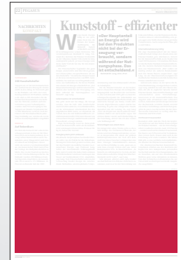
1/3 Seite 272 x 135 mm

Preis € 6.915,- Vorteilspreis € 4.840,50