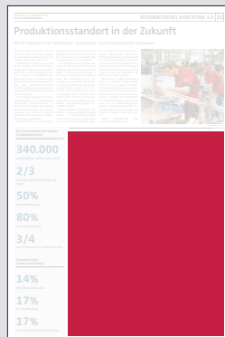
Juniorpage 202 x 265 mm

Preis € 13.830,- Vorteilspreis € 9.681,-