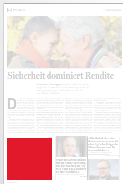
Steckbrief 2-spaltig 106,4 x 100 mm

Preis € 2.242,- Vorteilspreis € 1.569,40