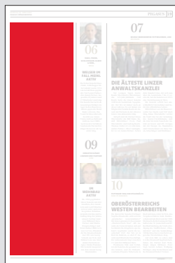
2-spaltig Hochformat 106,4 x 400 mm

Preis € 7.566,75 Vorteilspreis € 5.296,73