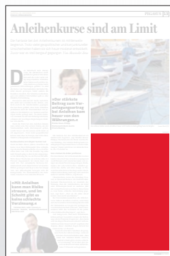
1/4 Seite 134 x 200 mm

Preis € 2.242,- Vorteilspreis € 1.569,40