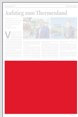
1/2 Seite 272 x 200 mm

Preis € 8.968,- Vorteilspreis € 6.277,60