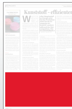
1/3 Seite 272 x 135 mm

Preis € 5.605,- Vorteilspreis € 3.923,50