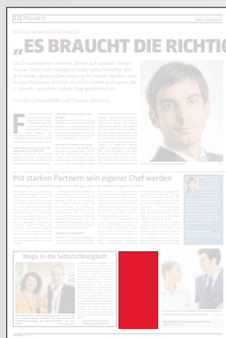
Steckbrief 1-spaltig 51,5 x 100 mm