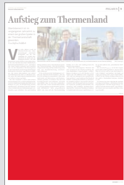
1/2 Seite 272 x 200 mm

Preis € 9.192,- Vorteilspreis € 6.434,40