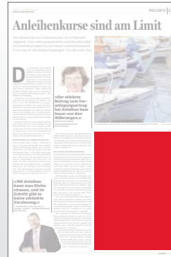
1/4 Seite 134 x 200 mm

Preis € 2.298,- Vorteilspreis € 1.608,60