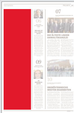
2-spaltig Hochformat 106,4 x 400 mm

Preis € 7.755,75 Vorteilspreis € 5.429,03