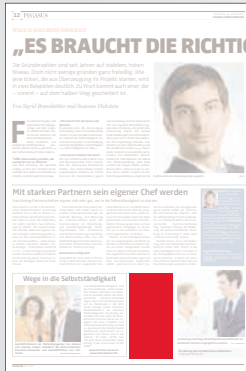
Steckbrief 1-spaltig 51,5 x 100 mm