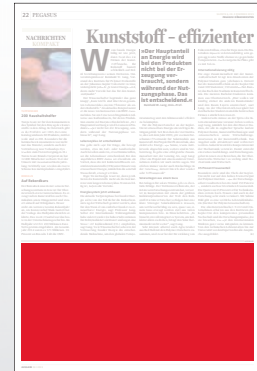
1/3 Seite 272 x 135 mm

Preis € 5.745,- Vorteilspreis € 4.021,50