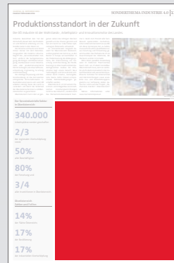
Juniorpage 202 x 265 mm

Preis € 11.490,- Vorteilspreis € 8.043,-