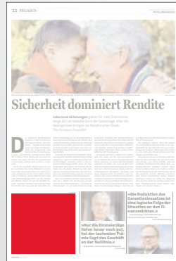
Steckbrief 2-spaltig 106,4 x 100 mm

Preis € 2.298,- Vorteilspreis € 1.608,60